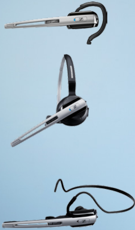
HINWEIS: Der Nackenbügel ist erhältlich als Zubehör