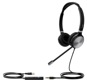
UH36 Dual Teams UH36 Dual UC