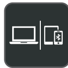
Anschluss mehrerer Geräte