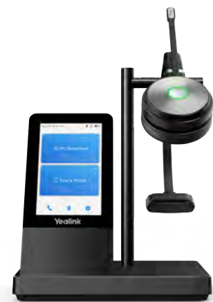
WH66 Mono/Dual: Teams WH66 Mono/Dual: UC