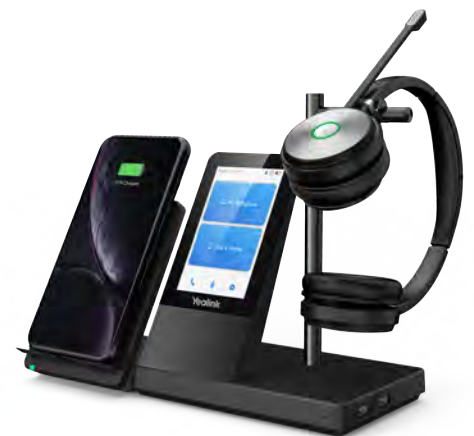
WH66 mit Ladegerät * drahtloses Ladegerät optional

Der WH66 ist Busylight-fähig. Leuchtet die Anzeige am Headset bzw. BLT60 auf dem Tisch rot, wird deutlich, dass der Anwender telefoniert und nicht unwissentlich unterbrochen werden sollte. Er kann sich weiter auf sein Gespräch konzentrieren, was für effizienteres Arbeiten und eine bessere Zusammenarbeit sorgt.